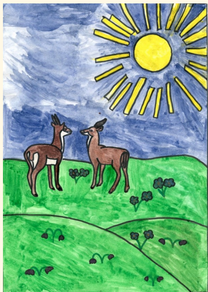
Иллюстрация к сказке выполнена автором сочинения

С тех пор олени стали домашними, и теперь их есть кому защищать.