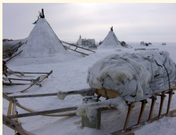
Иллюстрация неизвестного автора.

Вот такие замечательные сказки и стихотворение придумали ребята на конкурс. Надеемся, вам понравилось читать их сочинения.