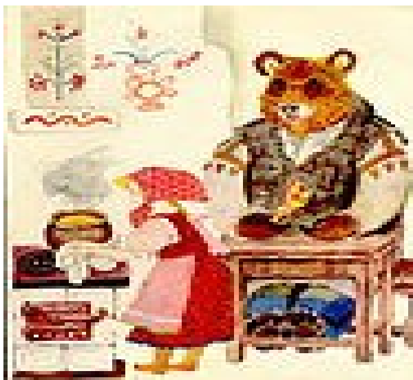
«Маша и медведь»