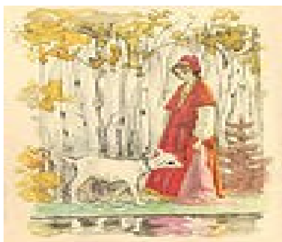
«Сестрица Аленушка и братец Иванушка»