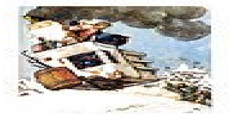
По щучьему велению»