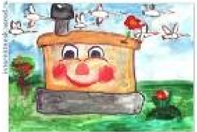
«Гуси – лебеди»